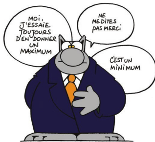
Le chat, Geluck