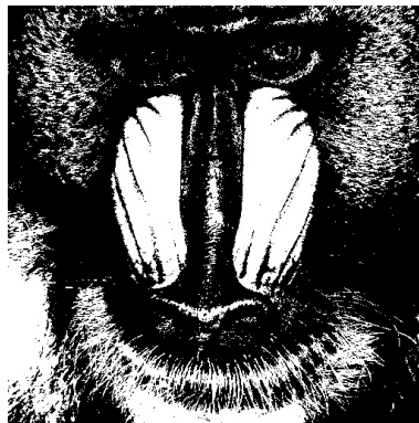
FIGURE 3 – Résultat de la binarisation.